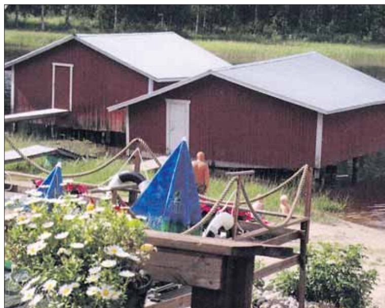
Rohkeimmat nauttivat rannan mahdollisuuksista.