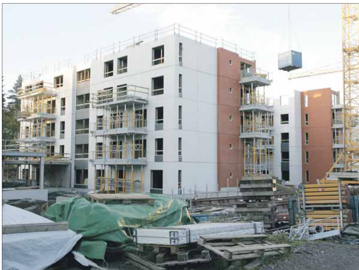
Työt Ritakadulla ovat alkaneet joulukuussa ja ensimmäisen vaiheen on määrä valmistua kesäkuussa 2010.