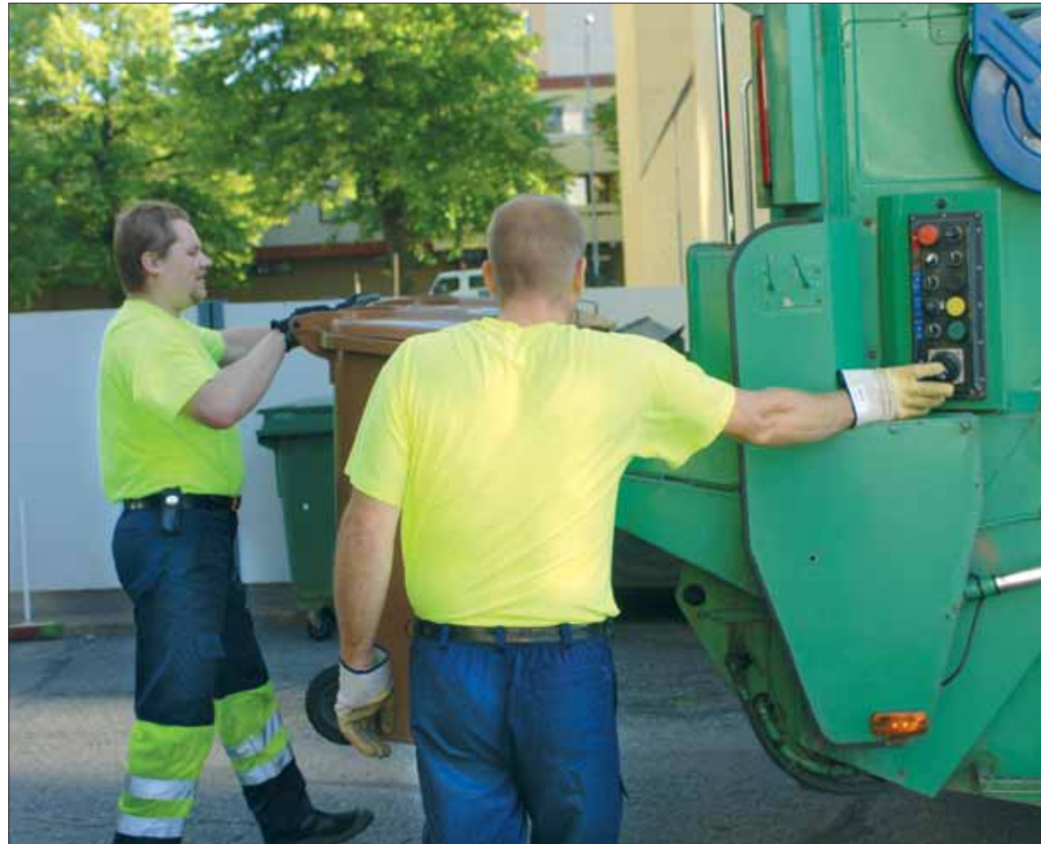
Biojäte kerätään ja käsitellään erikseen, jotta siitä syntyvä kasvihuonekaasu ei pääse karkaamaan kaatopaikalta tuuliin.

Biojäte pitää pakata maatuvaan pakkaukseen, joka ehkäisee hajuhaittoja ja astian likaantumista. Pakkaamiseen voi käyttää esimerkiksi sanomalehteä, sokeri- ja jauhopusseja, muropaketteja tai varta vasten biojätteen pakkaamiseen tarkoitettuja pusseja.