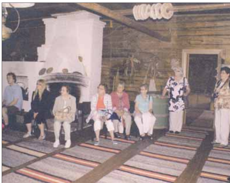
Tuvan hämärässä riitti tunnelmaa.