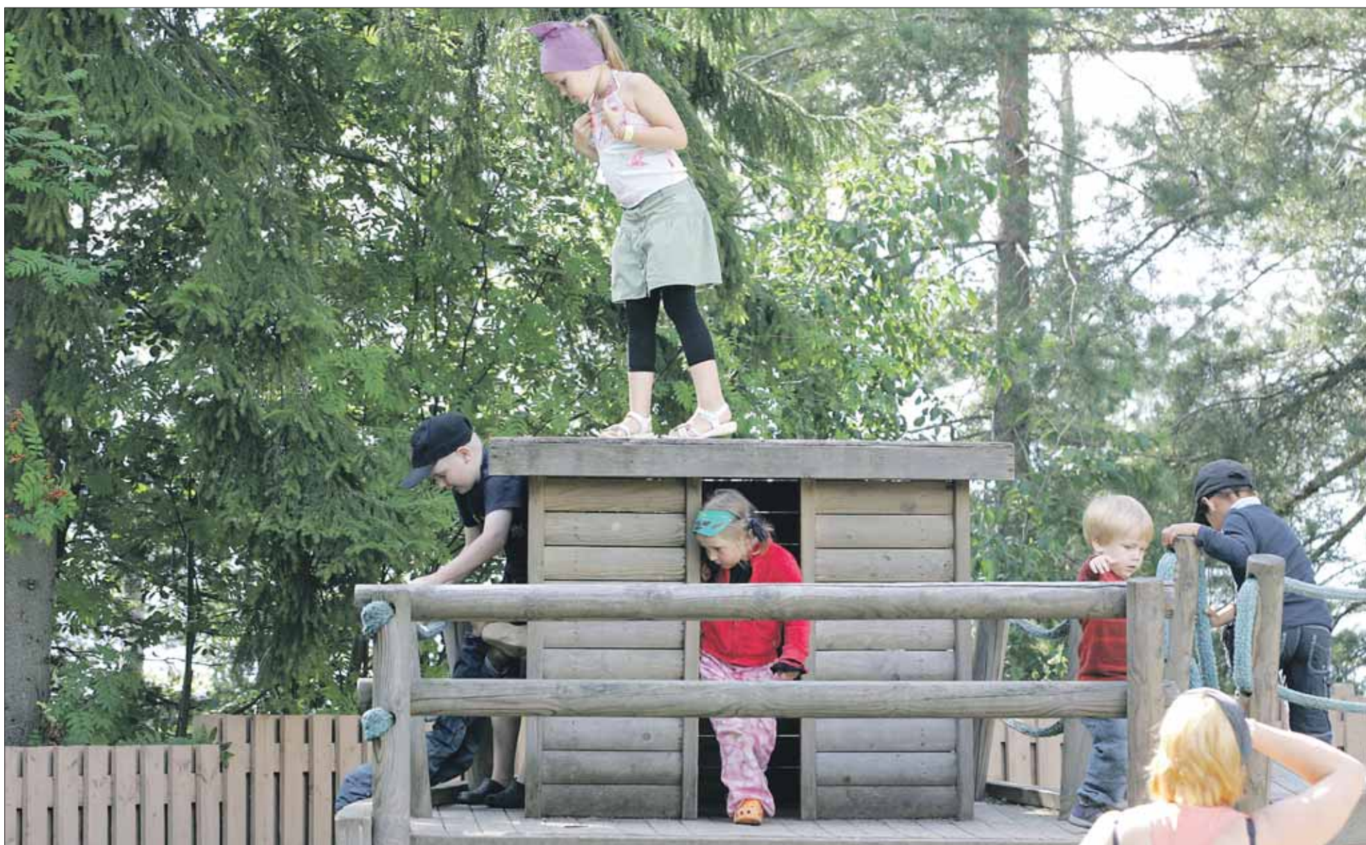
Kapteeni katolla ja miehistö valmistautumassa laivan liikkeellelaskuun. Viikinsaarella riittää mielenkiintoista puuhaa kaikenikäisille.