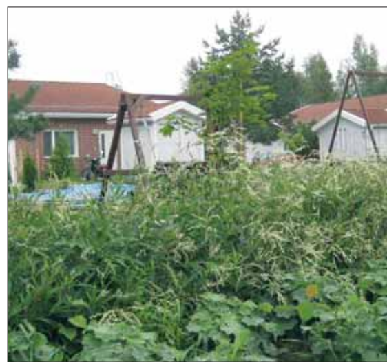
Vasemmalla on piha ruusupuskineen ennen, oikealla sama piha puutarhurien vierailun jälkeen.