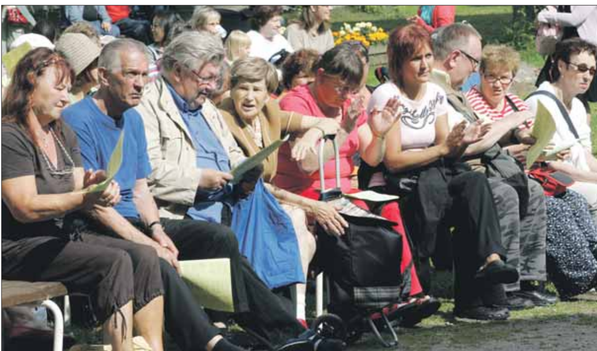
VTS:n asukkaat nauttivat auringosta ja yhdessäolosta.