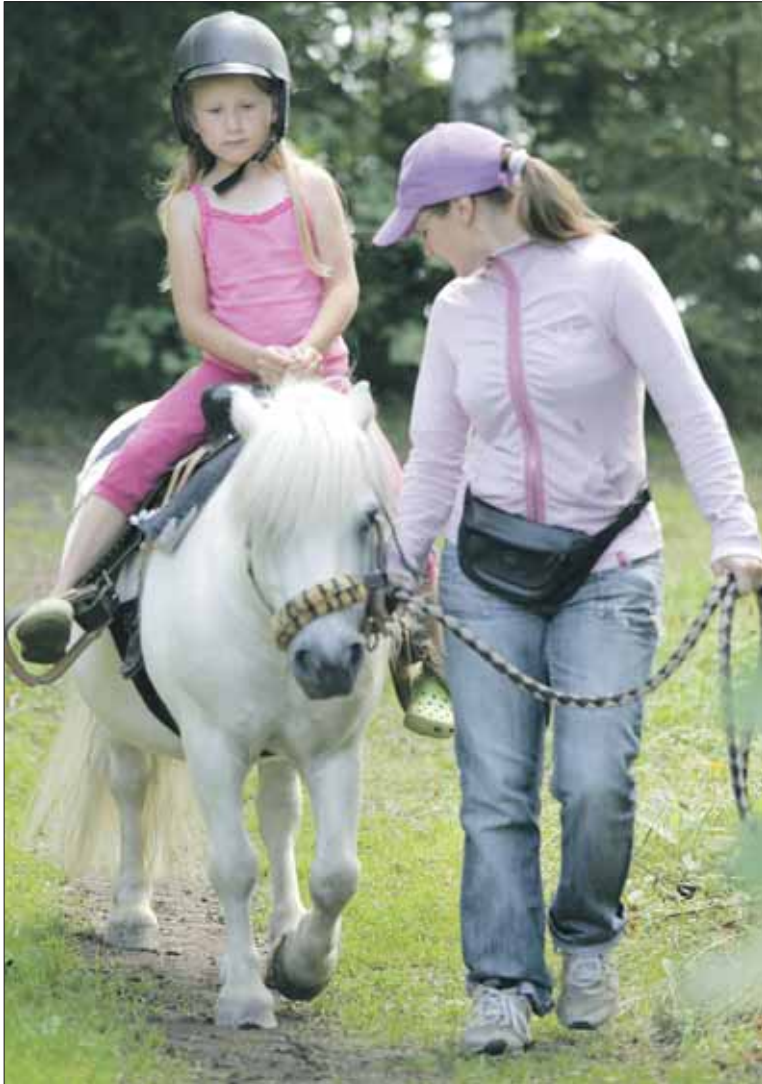
Ponikyty oli yksi päivän kohokohdista.

Ennätyselliset 1.200 VTS-kotien asukasta oli ilmoittautunut elokuussa vietettyyn Viikinsaaren asukastapahtumaan.