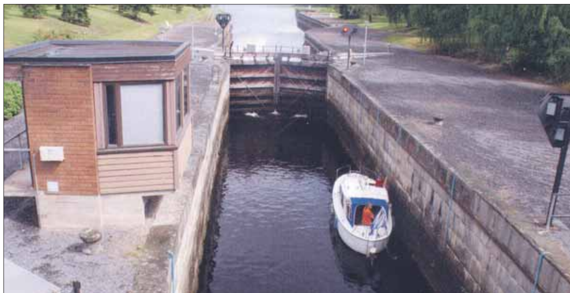
Kanavalla pieni vene odotti vuoroaan.