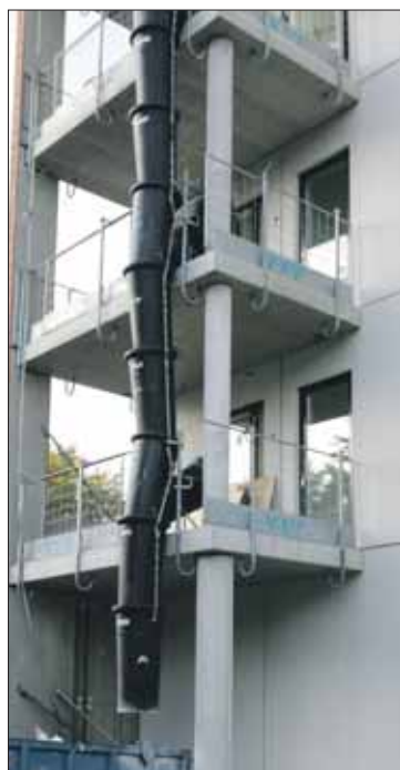
Asuinkerrostaloista tulee viisikerroksisia.

Alueelle rakennettava invalidien palvelukeskus palvelee etenkin liikuntavammaisia, mutta päivittäistavarakaupan ja päiväkodin palveluita pääsevät osalliseksi muutkin lähi-