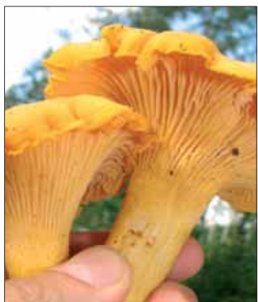
Kantarelli on herkullinen sieni.

Ympäristötietokeskus Moreenia sijaitsee keskellä Tammerkoskea, vesivoimarakennuksen kolmannessa kerroksessa. Sisäänkäynti on kevyen liikenteen Patosillalta.