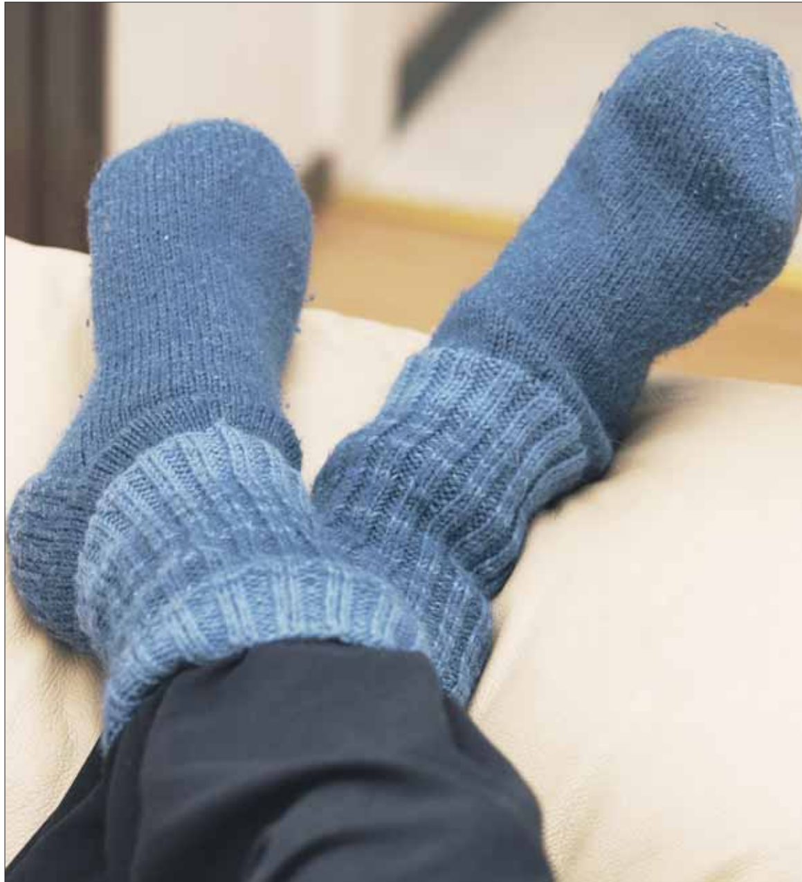
Villasukat on hyvä konsti hillitä ilmastonmuutosta. Kodin lämpötilaa voi laskea, kun varpaat eivät palele.