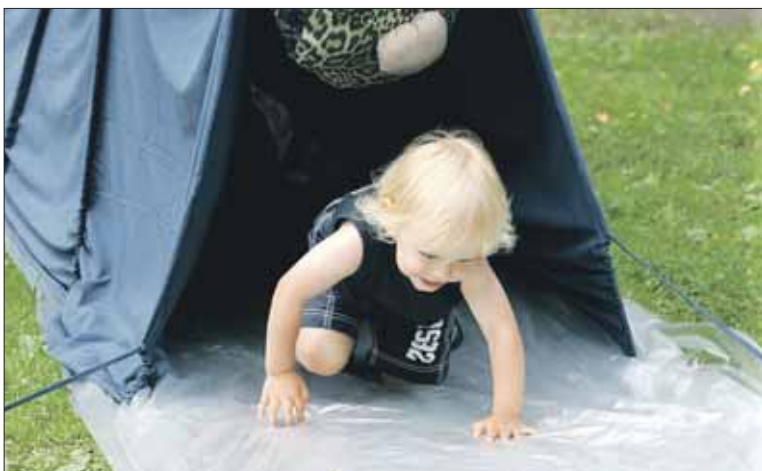
Tunnelista ulos ja uudelle kierrokselle!