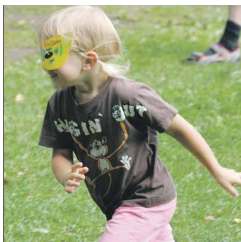
Täältä tulee naamarityttö!