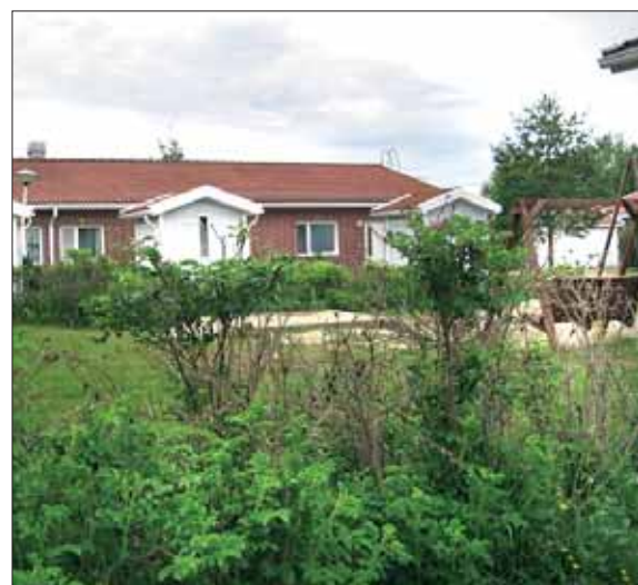
Kämmenniemen Huikulankadulla koko yhteispiha sai tänä vuonna uuden ilmeen.