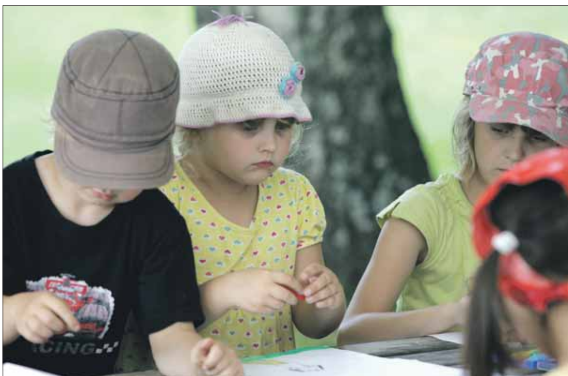
Askarteleminen vaatii keskittymistä.