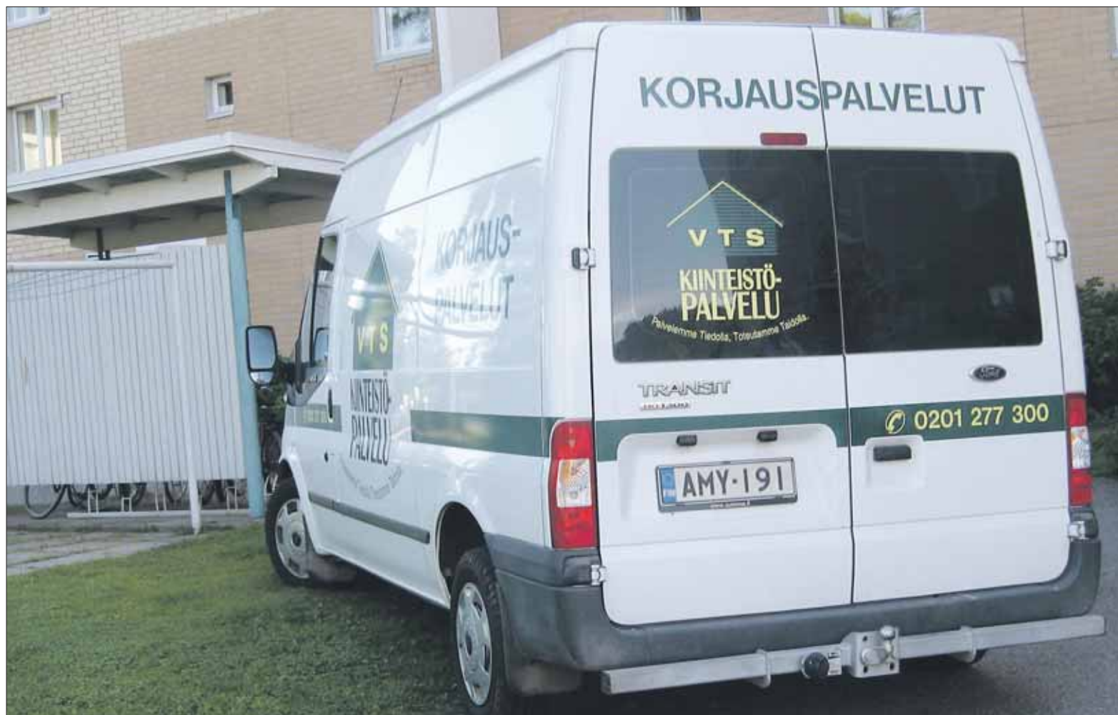
VTS-kotien verstaan henkilökunta siirtyy 1.10. alkaen vanhoina työntekijöinä Lännen Kiinteistöpalvelu Oy:n palvelukseen.