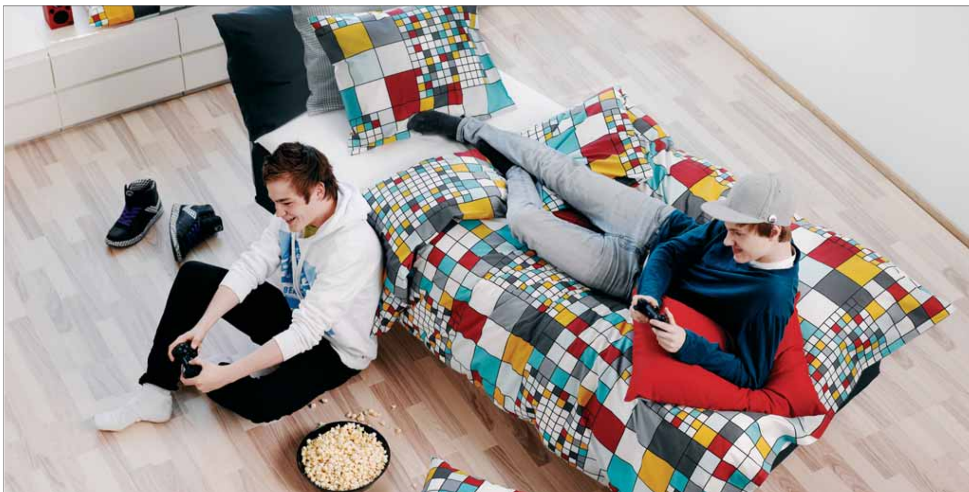
Tekstiilien kanssa saa käyttää mielikuvitusta. Pussilakana esimerkiksi käy vaihtelun vuoksi muuallekin kuin sänkyyn, vaikkapa verhoksi tai sohvän istuinosan päälle. Hyvän näköisiä kankaita voi myös pingottaa isoiksi sisustustauluiksi.

Loihdi helposti ja halvalla kivaa tunnelmaa ja uutta ilmettä syyskotiin