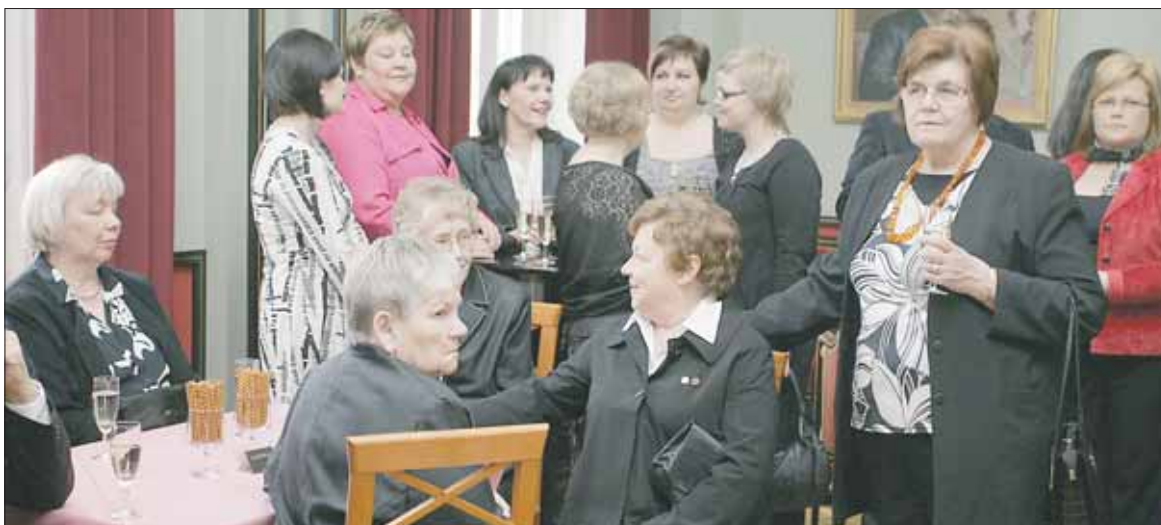
Tampereen Vuokratalosäätiön 40-vuotisjuhlaan Tampereen Teatteriin oli kutsuttu henkilökunnan lisäksi pitkäaikaisia asukkaita, asukasaktiiveja ja yhteistyökumppaneita. Pöydissä syntyi vilkasta keskustelua niin asumisesta kuin muistakin ajankohtaisista aiheista.