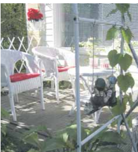
Matti Tapion kadun asukaspaha.

– Palkitsemme Jättikatajankatu 3:n, jonka asukkaat ovat tehneet paljon talkootyötä.