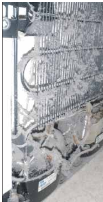
Uusi asukas järkyttyi nähdessään jääkaapin takaosassa olevan paksun pölykerroksen. Ei ihme, että jääkaappi lämpeni tavallista enemmän, sillä näin tiivis pölykerros tukkii ilmankieron.

Jääkaapin ja pakastimen tausta kannattaa putsata säännöllisesti myös säästösyistä. Laitteen sähkönkulutus voi nimittäin olla jopa kolminkertainen, jos riittävästä ilmankierrosta ja puhdistuksesta ei ole huolehdittu.