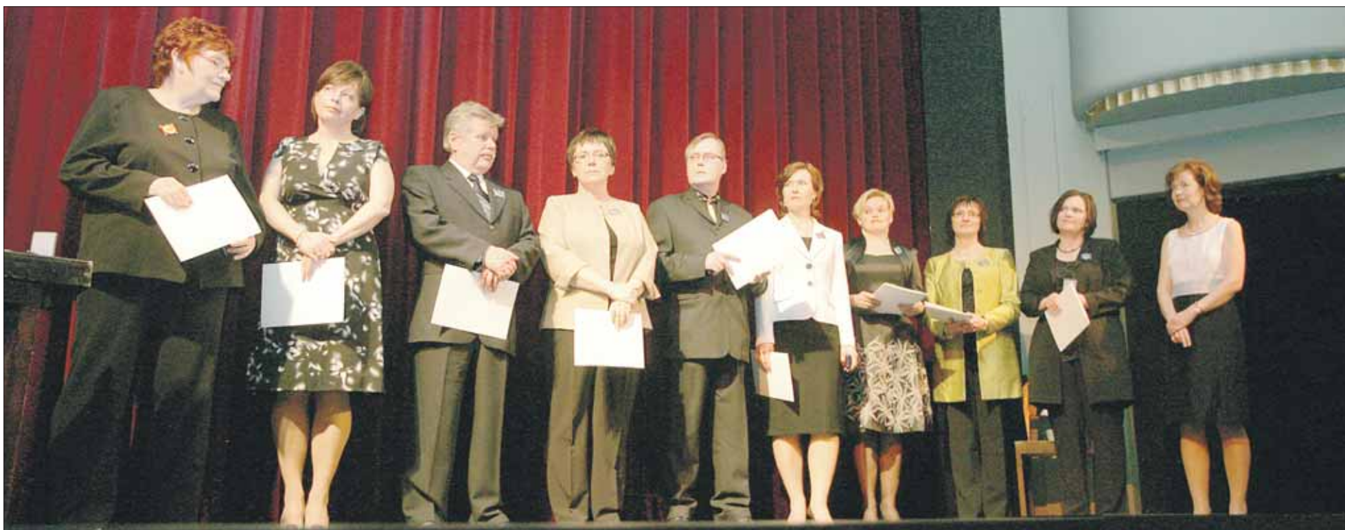
VTS muisti 40-vuotisjuhlassaan pitkän työuran säätiössä tehneitä työntekijöitään.