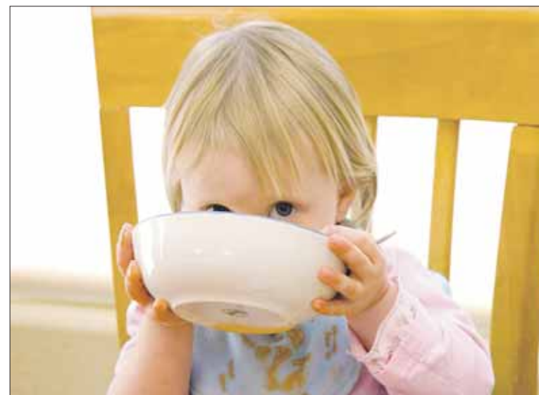
Perheet voivat asettaa tavoitteeksi esimerkiksi viikoittaisen kasvisruokapäivän.

Lisätiedot www.ilmankos.fi Teksti: Sanna Ovaska