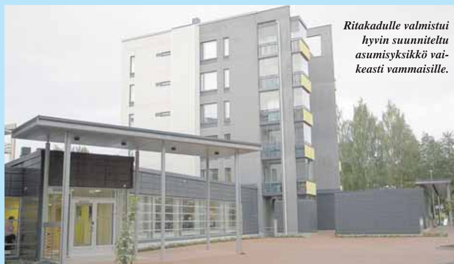
Ritakadulle valmistui hyvin suunniteltu asumisyksikkö vaikeasti vammaisille.