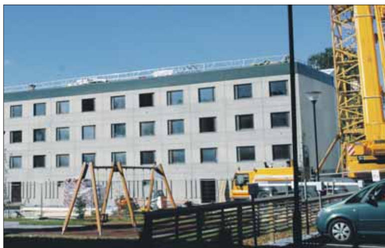
Nyt työn alla on jo valmistuneen kohteen naapuritalo Takunvainionkatu 2:ssa. Täältä näytti myös Ojavainionkatu 6 ennen perusparannusta.

vaihe on Kolunkatu 3:n suunnittelu, joka alkaa tänä syksynä. Vielä ei ole päätetty rakennetaanko kiinteistöön uusi kerros.