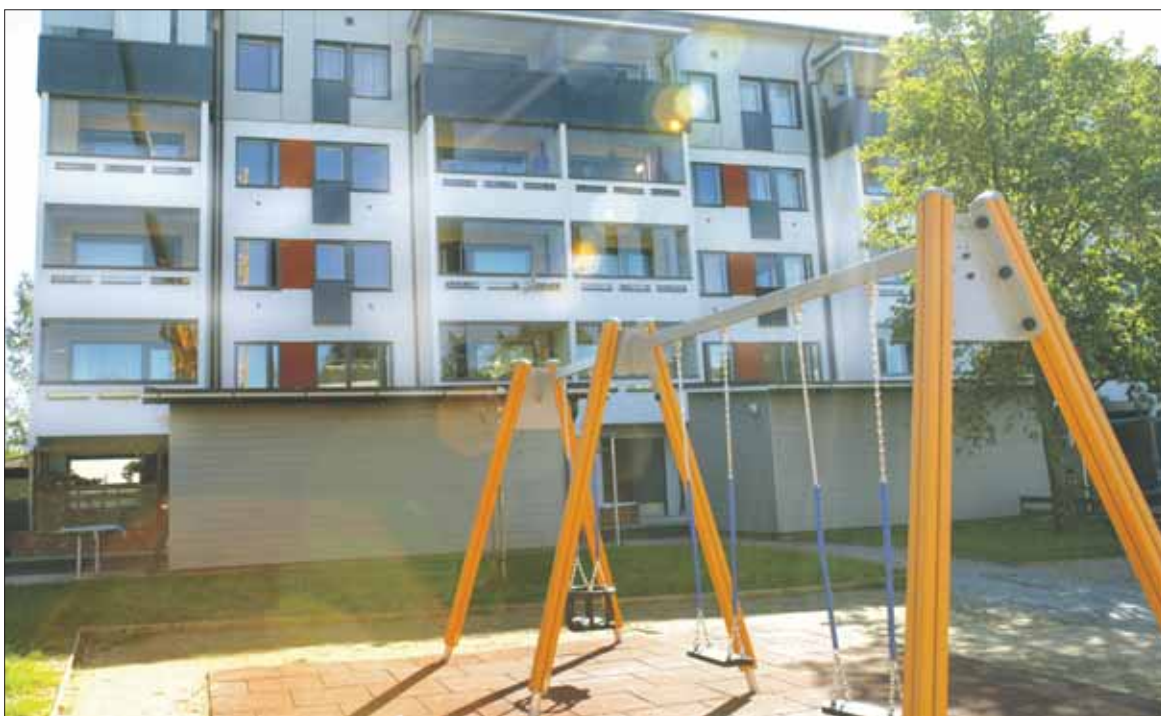
Täysin uudistettua kerrostaloa ei enää uskoisi 1970-luvulla rakennetuksi. Yhtä näyttävä remontti on tulossa myös kaikkiin muihin Vilusen Rinne Oy:n Annalan kohteisiin.