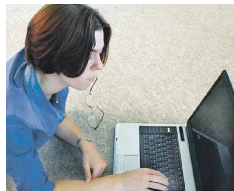
Ensi vuonna laajakaista kulkee VTS-koteihin nopeita kuituyhteyksiä pitkin.

Liittymät otetaan käyttöön vaihteittain ensi vuoden aikana. Tarkempi aikataulu sovitaan syksyn aikana ja asiasta tiedotetaan asukkaille myöhemmin.