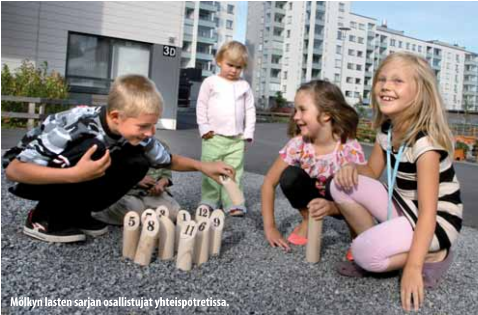
Mölkyn lasten sarjan osallistujat yhteispöytäpotretissa.