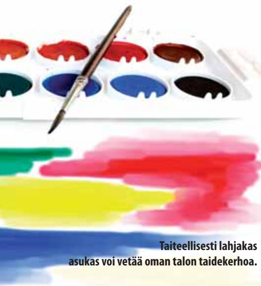
Taiteellisesti lahjakas asukas voi vetää oman talon taidekerhoa.

Hänet tavoittaa sähköpostilla osoitteesta vtsasukastoiminta@gmail.com ja puhelinnumerosta 050 361 9744.