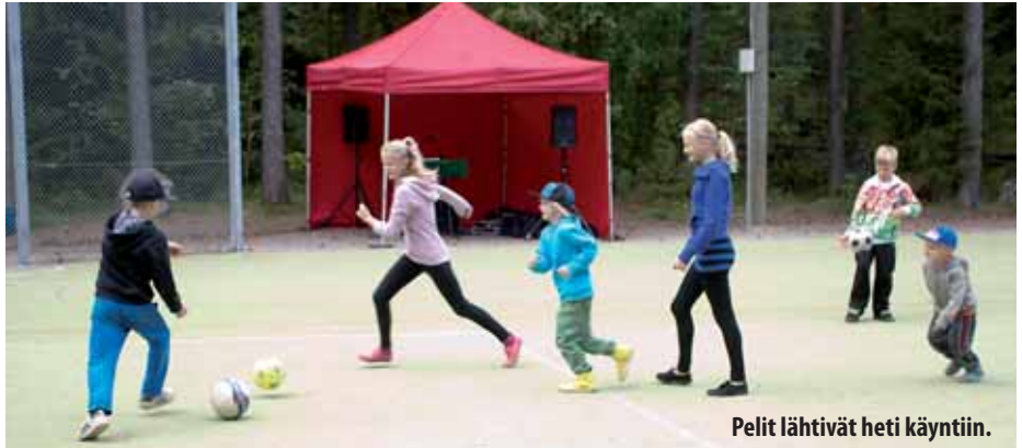
Pelit lähtivät heti käyntiin.

– Se piti asentaa jo viime syksynä, mutta sateiset kelit sotkivat suunnitelmat. Nyt homma vihdoinkin onnistui. Ensimmäiset pelit olivat käynnissä jo samana päivänä, kun pinta oli