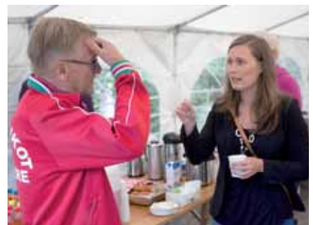
Valtuuston puheenjohtaja Sanna Marin kentän vihkiäisissä.