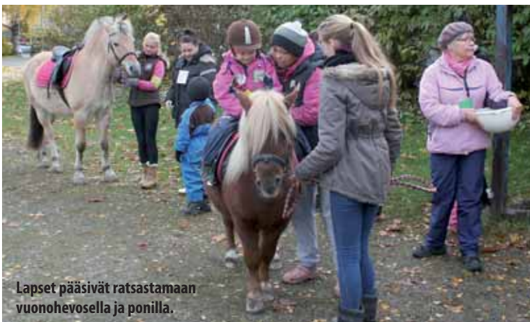
Lapset pääsivät ratsastamaan vuonohevosella ja ponilla.