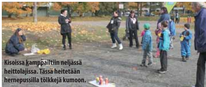
Kisoissa kamppailtiin neljässä heittolajissa. Tässä heitetään hernepussilla tölkkejä kumoon.

–Tärkein tavoite meillä oli, että talojen väki tutustuisi toisiinsa. Siinä taisimme onnistua, sillä raitilla on nyt tervehditty myös uusia kasvoja, talkoolaiset iloitsevat.