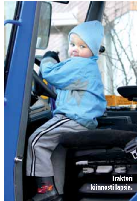
Traktori kiinnosti lapsia.