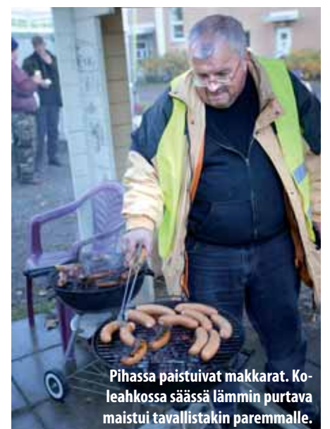
Pihassa paistuivat makkarat. Ko-leahkossa säässä lämmin purtava maistui tavallistakin paremmalle.