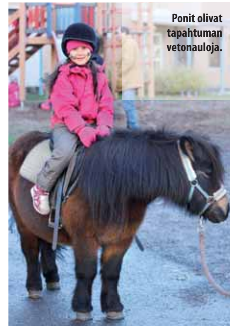
Ponit olivat tapahtuman vetonauloja.

Pihalla makkarat paistuivat grillissä ja kahvi maistui kaikille, joten sääherran pelottelusta huolimatta tapahtumasta saatiin oikein onnistunut iltapäivä Hallilan asukkaille.