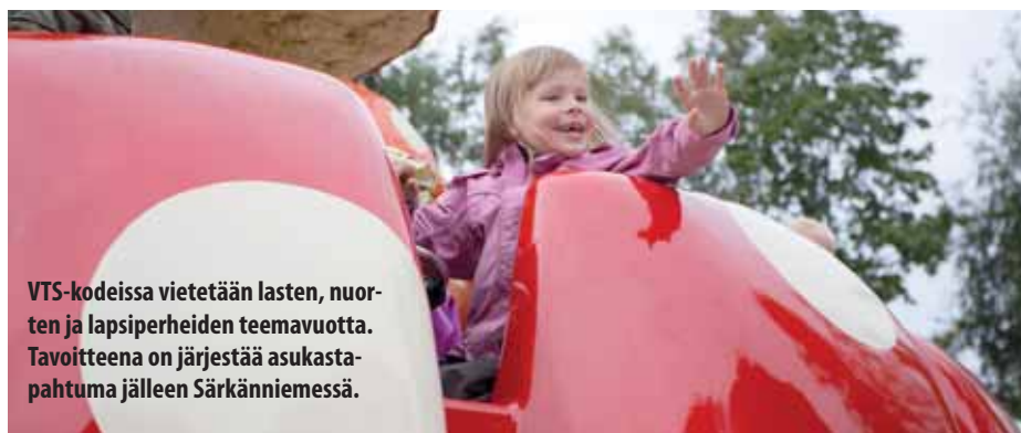
VTS-kodeissa vietetään lasten, nuorten ja lapsiperheiden teemavuotta. Tavoitteena on järjestää asukastapahtuma jälleen Särkänniemessä.

Puheenjohtajat valitsivat uuden AD-ryhmän, jonka kokoonpano ja yhteystiedot löytyvät tämän lehden sivulta 11. Hallituksen puheen-