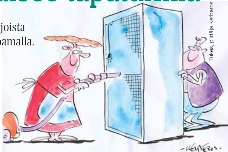
Tukes, piirtäjä Kerberos