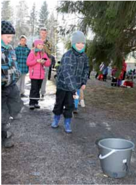
Pallonheitossa tarvittiin taitoa ja vähän tuuriakin.