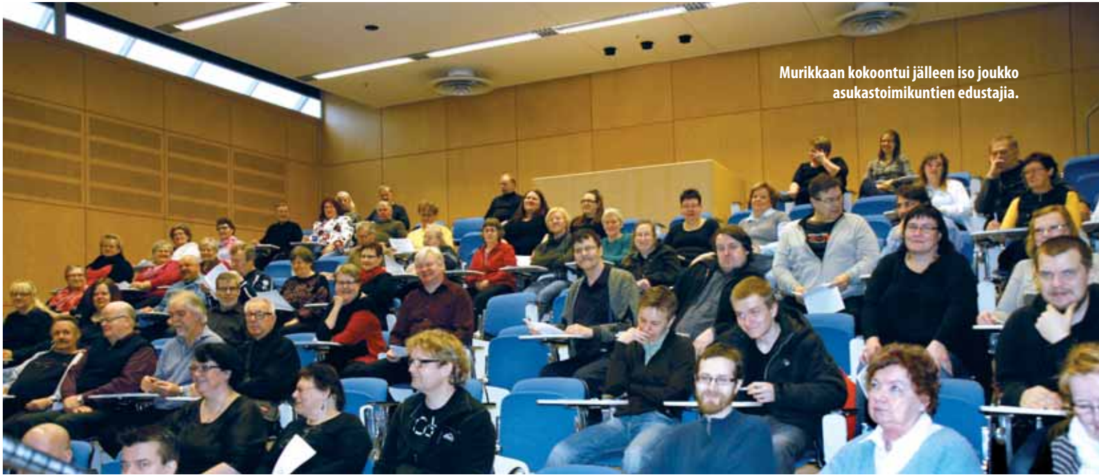
Murikkaan kokoontui jälleen iso joukko asukastoimikuntien edustajia.