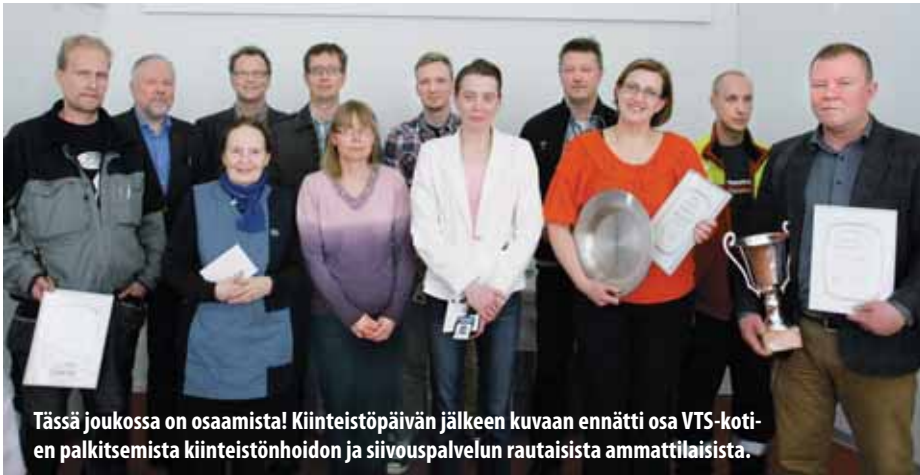
Tässä joukossa on osaamista! Kiinteistöpäivän jälkeen kuvaan ennätti osa VTS-kotien palkitsemista kiinteistönhoidon ja siivouspalvelun rautaisista ammattilaisista.