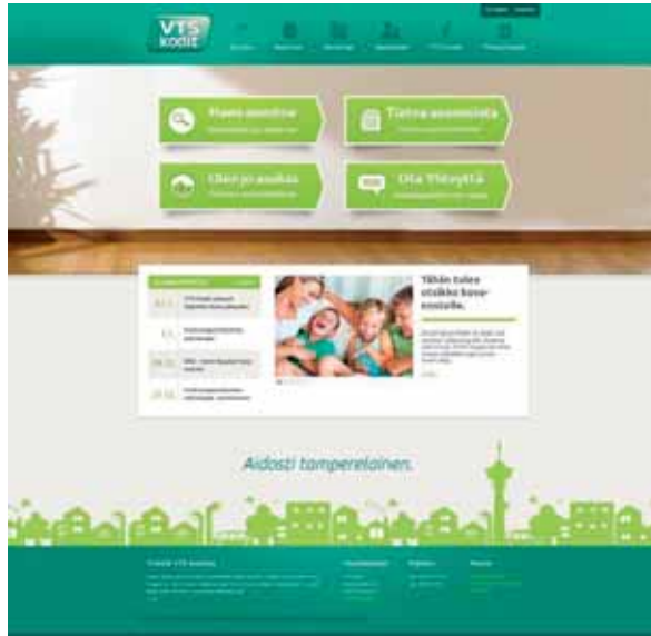
Asiointi hoituu helposti VTS-kotien uusilla, valmisteilla olevilla nettisivuilla.

– Syksyllä meille on tulossa myös uusia sähköisiä palveluja, kuten sähköinen allekirjoitus ja graafiset autopaikkojen varaukset. Jo olemassa olevia sähköisiä palveluja on yksinkertaistettu ja niiden toimintaa varmen-