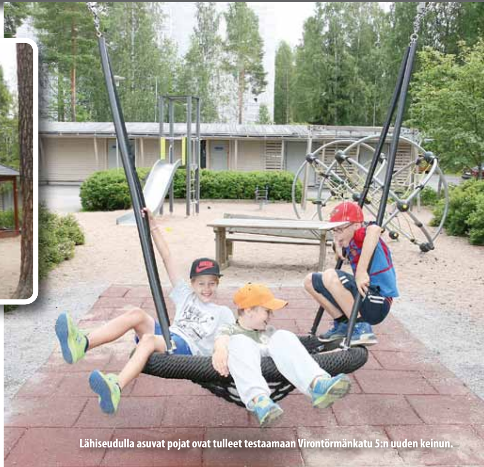
Lähiseudulla asuvat pojat ovat tulleet testaamaan Vironrörmänkatu 5:n uuden keinun.

Tänä vuonna on Oma Tesoma -hankkeeseen liittyen kunnostettu neljä VTS-kotien pihaa. Valtio osallistui kustannuksiin 25 prosentin ARA-rahoituksella.