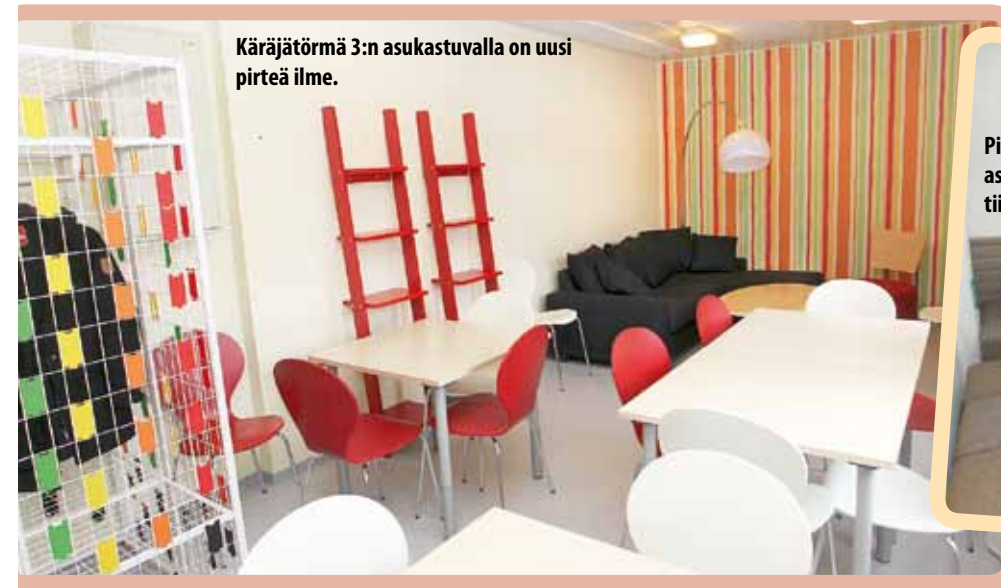
Käräjätörmä 3:n asukastuvalla on uusi pirteä ilme.