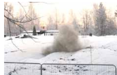
Siinä se on, työmaan ensimmäinen pamaus.

VTS-kodit rakennuttaa Hervantaan asuinrakennuksen, jonka asunnot on tarkoitettu kuurosokeille ja viittomakielisille asukkailla.