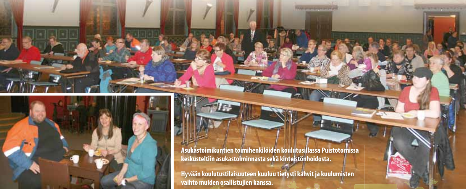
Asukastoimikuntien toimihenkilöiden koulutusillalla Puistotornissa keskusteltiin asukastolinnasta sekä kiinteistönhoidosta.

– Pidämme edelleen kiinni periaatteestamme, että erityisryhmien osuus asukkaista ei nouse missään talossa kohtuuttomaksi eli yli 20 prosenttiin.