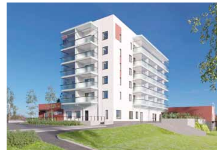
Tältä uudisrakennus näyttää valmiina. Havainnekuva: Arkkitehtitoimisto AR-Vastamäki Oy.

Alkuvuodesta 2017 valmistuvaan kiinteistöön tulee 19 vuokra-asuntoa, 15 tehostetun palveluasumisen asuntoa sekä 11-paikkainen tehostetun palveluasumisen ryhmäkoti. Lisäksi