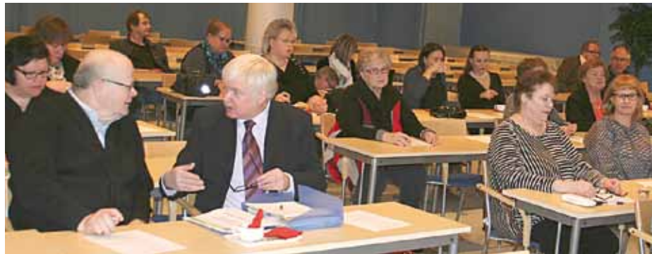
Puheenjohtajat kokoustivat Tampere-talossa.

VTS-kotien lähettämien häiriöhuomautusten määrä on vähentynyt vuosi vuodelta.