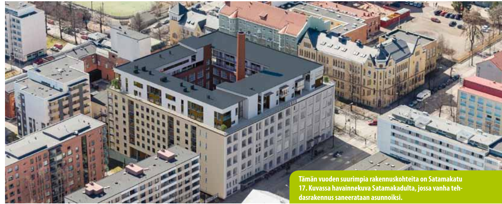
Tämän vuoden suurimpia rakennuskohteita on Satamakatu 17. Kuvassa havainnekuva Satamakadulta, jossa vanha tehdasrakennus saneerataan asunnoiksi.