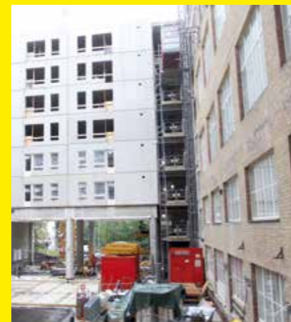
Satamakatu 17 rakentuu.

Hervantaan on suunnitteilla kaksi kerrostaloa, joihin tulee yhteensä noin sata asuntoa. Tontinkäyttösuunnitelmaa laaditaan parhaillaan, rakentaminen on tarkoitus aloittaa loppuvuodesta 2018 ja arvioitu valmistumisajankohta on keväällä 2020.