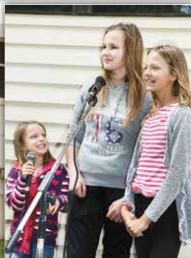
Käräjätörmän tyttöjen Sininen ja valkoinen soi kauniisti.