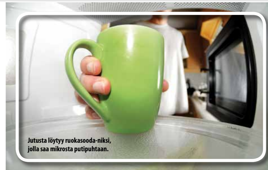
Jutusta löytyy ruokasooda-niksi, jolla saa mikrosta putipuhdasta.

KOKKIKERHO keskiviikkoisin klo 11–15 Käräjätörmä 4 kerhohuone alkaen 13.9. Avoin kokkikerho, yhdessä tehden ruokaa ja yhdessäoloa.