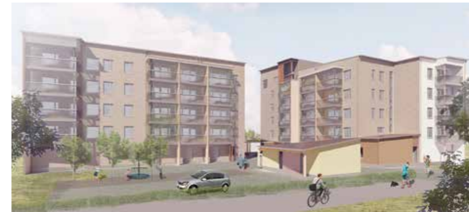
Viri Kolunkatu 1 rakentuu Annalaan purettujen vanhojen kerrostalojen paikalle.

VTS-kodit seuraa tarkasti muun muassa laitteiston takaisinmaksuaikojaa ja saatua energiansäästöä. Mikäli kokemukset ovat myönteisiä, saattaa aurinkoenergia lämmittää myös tulevana vuosina rakennettavia VTS-koteja.