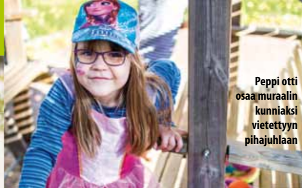
Peppi otti osaa muraalin kunniaksi vietettyyn pihajuhlaan