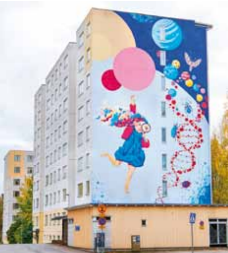
Muraalin koko on 338 neliometriä.

Opiskelijankadun muraalihankkeessa ovat mukana Katutaidekilta G-REX ja Lastenkulttuurikonsepti SirkusRakkausPumPum. Hanketta tukevat VTS-kodit, Taiteen edistämiskeskus ja nostinfirma Cramo.