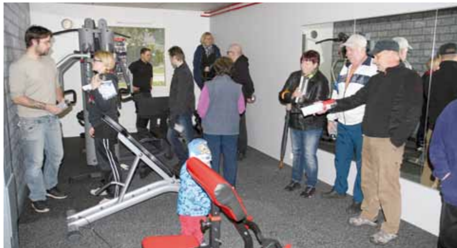
RunkoGym sai Runkokadun VTS-kotien asukkailta hyvän vastaanoton.

– Olen nähnyt aika monia taloyhtiösaleja, ja tämä on kyllä laitevalikoimaltaan sieltä katavimmasta päästä. Lisäksi tila on remontoitu