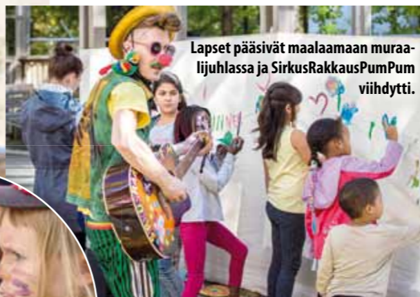
Lapset pääsivät maalaamaan muraalijuhlissa ja SirkusRakkausPumPum viihdytti.