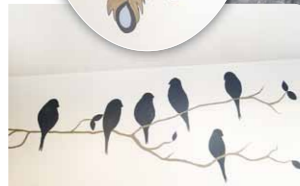
Maalarit ovat koristelleet asukastupia esimerkiksi lintu- ja sulka-maalauksin.