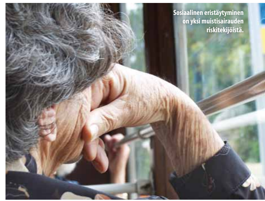
Sosiaalinen eristäytyminen on yksi muistisairauden riskitekijöistä.