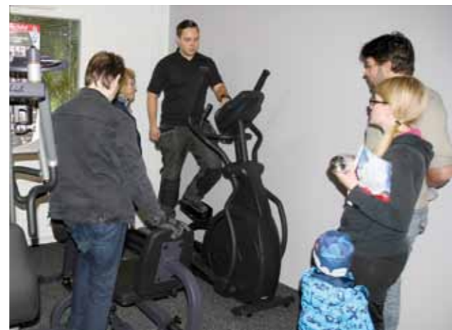
Kuntokeskus on tehokas, monta laitetta sisältävä yksikkö, jossa voi treenata koko vartaloa. Crosstrainer puolestaan on helppokäyttöinen ja tehokas kuntoiluväline.