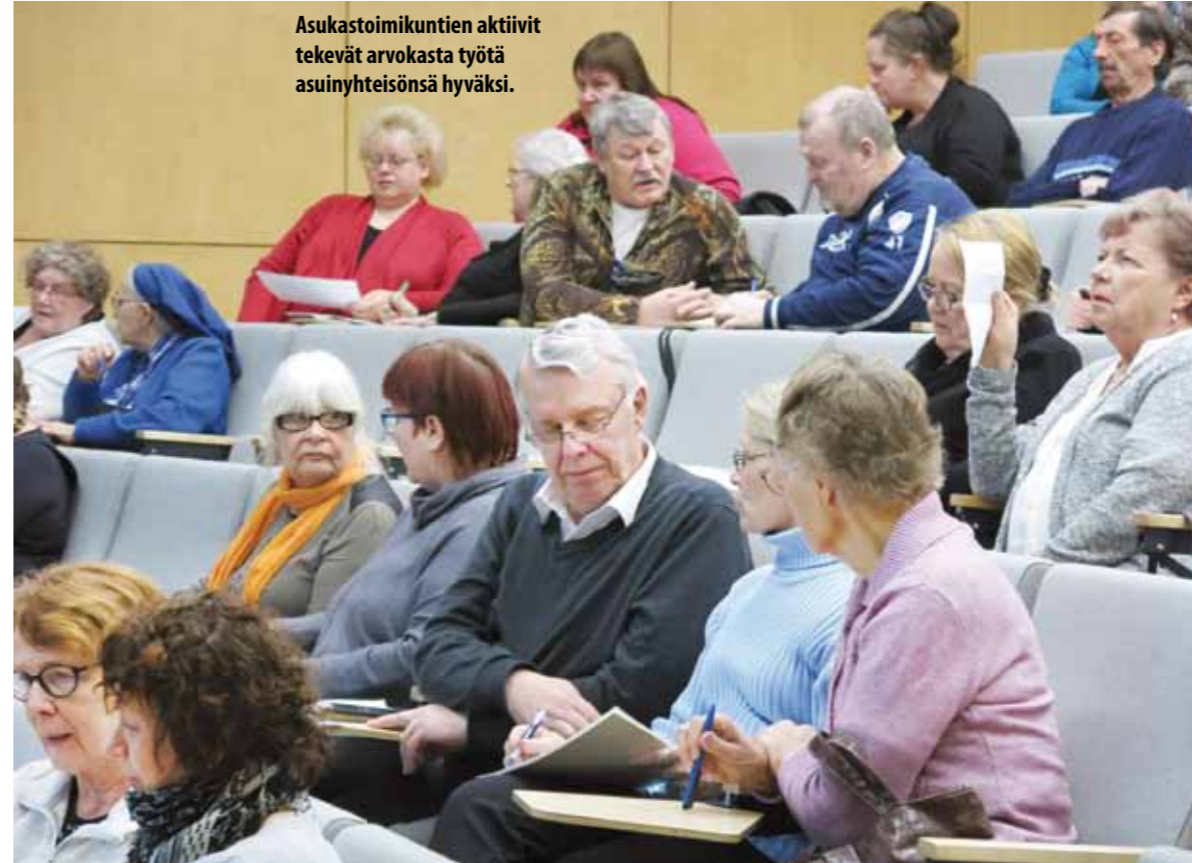
Asukastoimikuntien aktiivit tekevät arvokasta työtä asuinyhteisönsä hyväksi.

Yli 80 VTS-kotien asukasaktiivia vietti mukavan lauantapäivän maaliskuussa Murikassa. Teemaksi oli tällä kertaa nostettu sisäilmaongelmat ja asumisterveys.