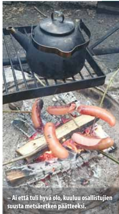
– Ai että tuli hyvä olo, kuuluu osallistujien suusta metsäretken päätteeksi.

Y ja M –lapsiperheiden mukana -hanketta rahoittaa STM Veikkauksen tuotoilla ja sen toiminta-aika on 1.1.2018–31.12.2020. Tavoitteena on lapsiperheiden hyvinvointia tukevan ja ongelmia ehkäisevän korttelitoiminnan, ryhmätoiminnan, leirien, retkien ja kurssien toteuttaminen Tampereella sekä lähikunnissa.