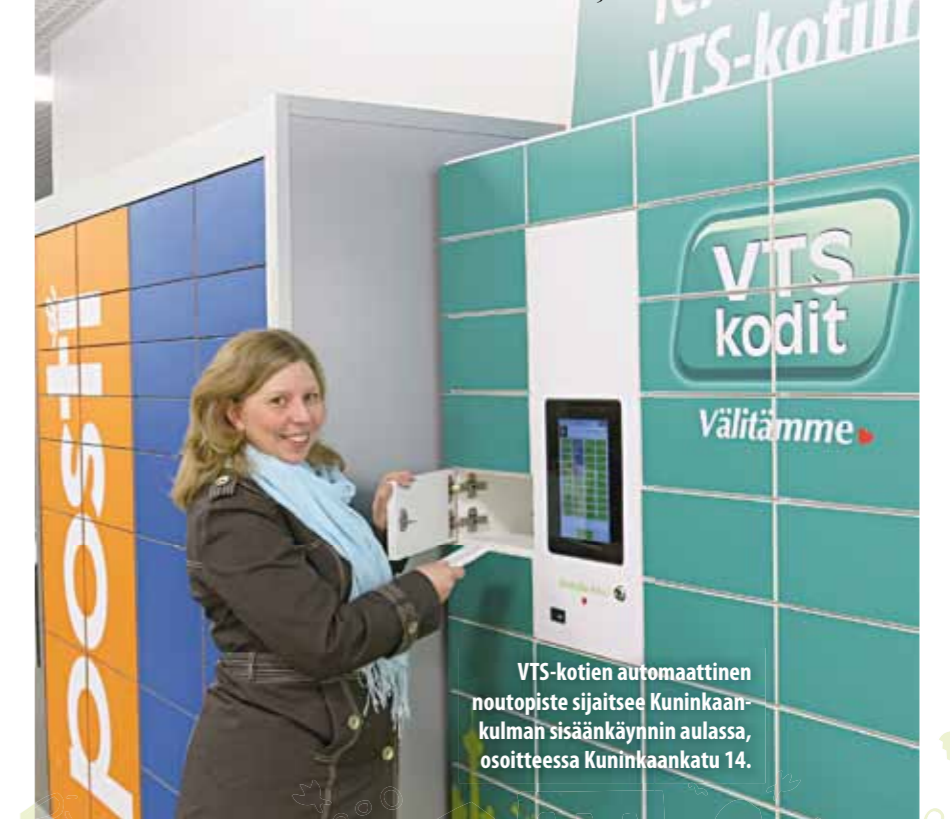
VTS-kotien automaattinen noutopiste sijaitsee Kuninkaankulman sisäänkäynnin aulassa, osoitteessa Kuninkaankatu 14.

Helppokäyttöinen noutoautomaatti toimii samalla periaatteella kuin Postin pakettiautomaatti. Asiakas saa tekstiviestillä noutokoodin, joka naputellaan automaattiin, lokeron ovi aukeaa ja asiakas voi ottaa avaimensa.