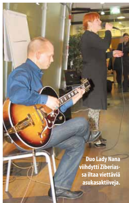
Duo Lady Nana viihdytti Ziberiassa iltaa viettäviä asukasaktiiveja.

Hän oli vaikuttunut etenkin aktiivisesta asu-