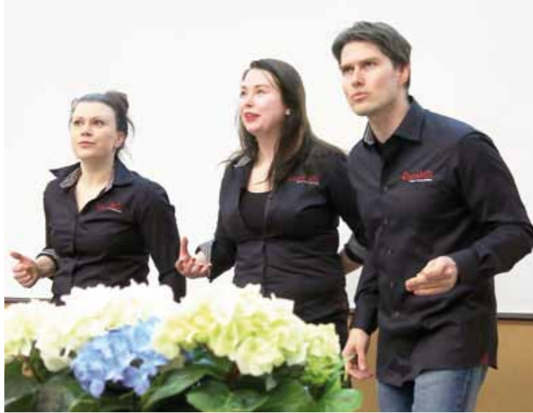
Improvisaatioteatteri Snorkkeli nauratti VTS-kotien asukasaktiiveja ja henkilökuntaa.