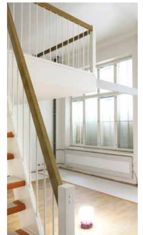
Korkeat asunnot ovat isojen ikkunoiden ansiosta todella valoisia.

Historiallisessa rakennuksessa on toiminut sukkatehtaan jälkeen muun muassa Pyyntikinin terveysasema ja kaupungin sosiaalitoimi.