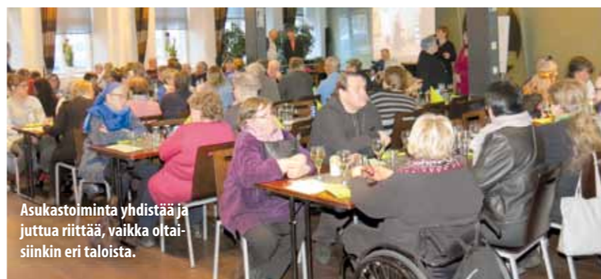
Asukastoiminta yhdistää ja juttua riittää, vaikka oltai-sinkin eri taloista.