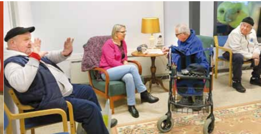
Kaiku avasi marraskuussa Kaukajärven S-marketin aulaan pop-upin, pienen Juttelukammarin. Siihen on helppo pistäytyä ja tutustua toimintaan.