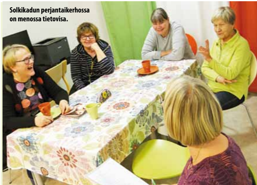
Solkikadun perjantaikerhossa on menossa tietovisa.