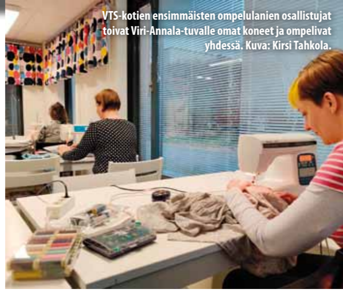
VTS-kotien ensimmäisten ompelulanien osallistujat toivat Viri-Annala-tuvalle omat koneet ja ompelevat yhdessä.

hin, useammalla paikkakunnalla samanaikaisesti järjestettäviin, käsityöyhdistysten isännöimiin festivaaleihin asti. Ompelulaneilla saa arvokasta vertaistukea toisilta käsityöharrastajilta ja mikä parasta, laneilla voi pyhittää monta tuntia vain ompelulle! ViRi Annalan käsityö- ja askarteluryhmän kokoontumisissa on kudottu, virkattu ja leikkaa-liimaa-skarreltu, mutta yhteisompelupäivä ei ole aiemmin järjestetty. Takunvainionkatu 2 korttelitu-