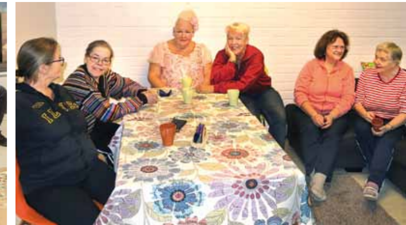
Kaiku-hanke polkaisi kerhotoiminnan alkuun ja nyt kerhot ovat itsenäistyneet niin, että ohjaajat voivat siirtyä Annalaan.