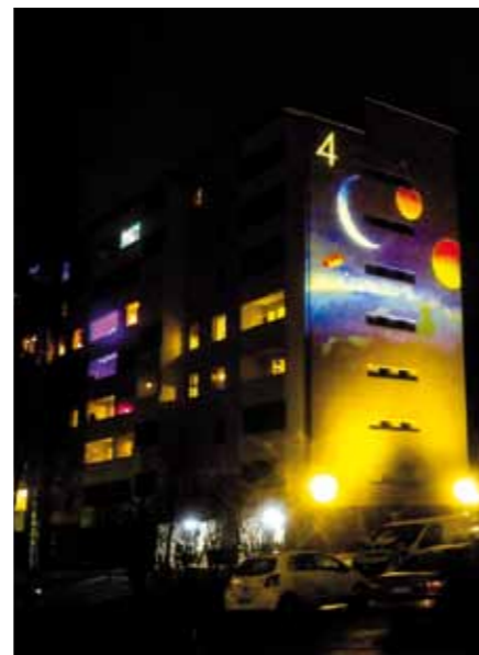
Valomuraalien kuvat vaihtuvat aina silloin tällöin, joka talolla on kaikkiaan viisi kuvaa.

Virontörmänkatu 4:ssä on panostettu valomuraalien lisäksi ympäristövalaistukseen. Muraalit toteuttanut Valoa Design on suunnitellut pihan tunnelmallisen valaistuksen, joka ei häikäise kulkijoita, vaan