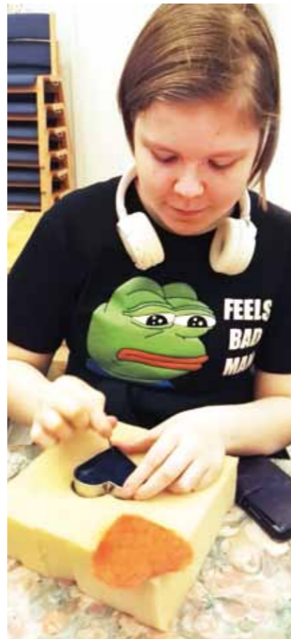
Hallila-seuran suosittu askartelutapahtuma järjestetään aina joulun alla.

Hallila-seura tekee yhteistyötä esimerkiksi seurakunnan, koulun