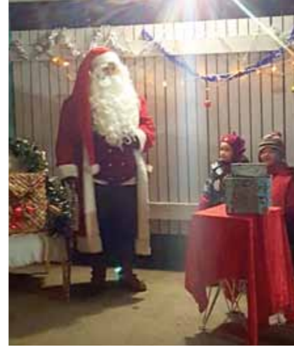
Taikova joulupukki riemastutti lapsia VTS-kotien puurojuhlassa.

vanhempainyhdistyksen, alueen yrittäjien sekä VTS-kotien kanssa. Viime vuonna seura järjesti kaksi isompaa tapahtumaa, perheiden jouluaskartelun sekä toripäivän.