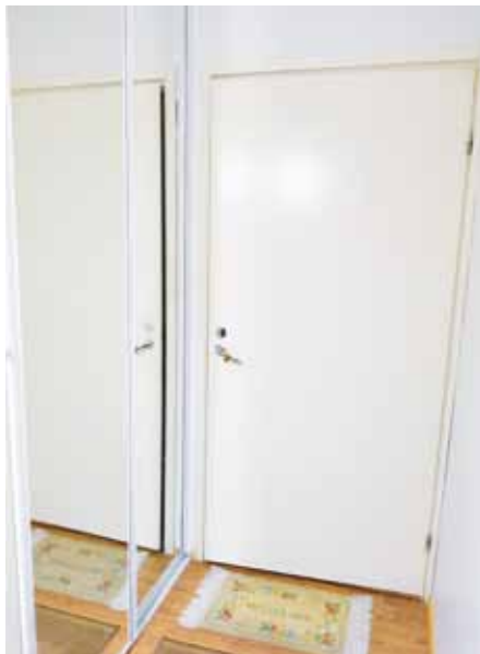
Peililiukuovet piilottavat naulakon.

– Olen niihin oikein tyytyväinen. Asentaja asensi liukuovet nope-