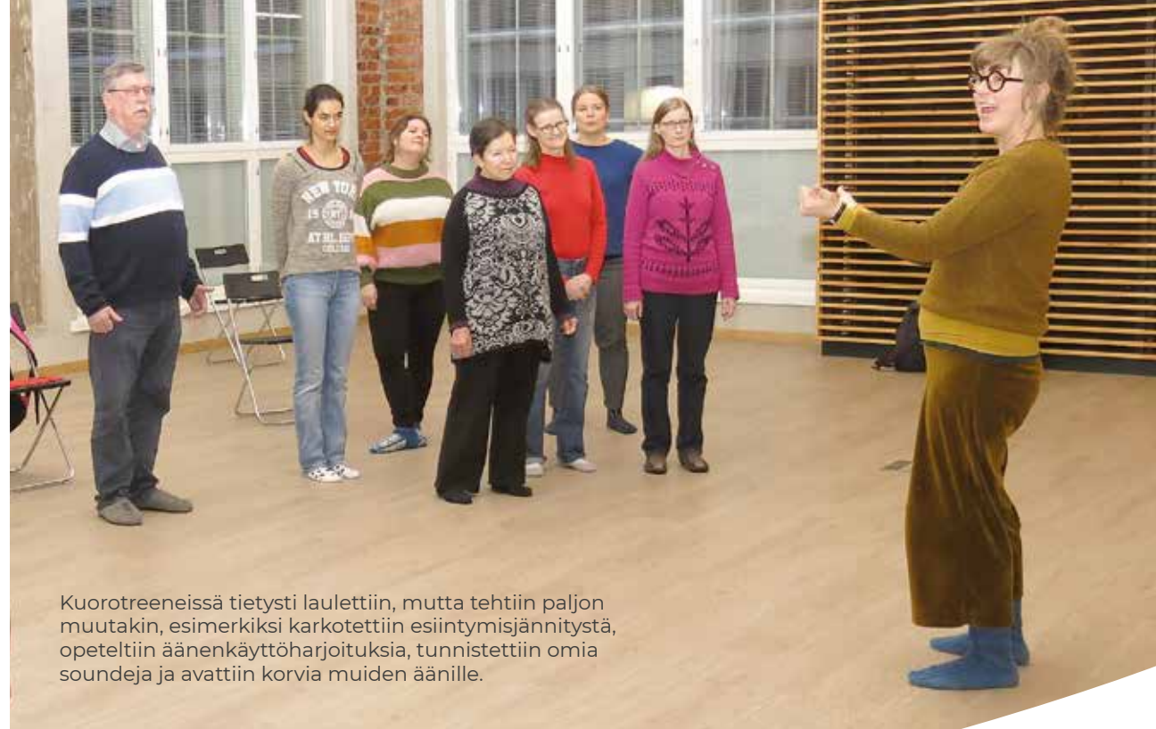
Kuorotreenissä tietysti laulettiin, mutta tehtiin paljon muutakin, esimerkiksi karkotettiin esiintymisjännitystä, opeteltiin äänenkäyttöharjoituksia, tunnistettiin omia soundeja ja avattiin korvia muiden äänille.