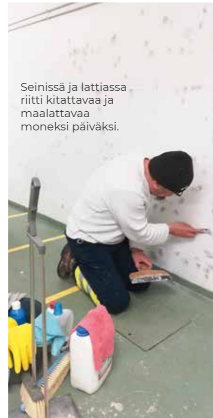
Seinissä ja lattiassa riitti kitattavaa ja maalattavaa moneksi päiväksi.

– Asukastupaa on tarkoitus käyttää myös juhlatilana, joten kalus-