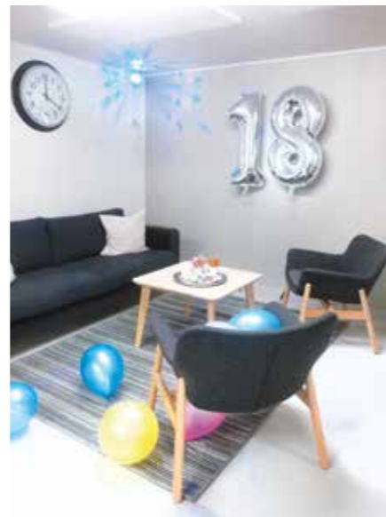
Asukastupa valmiina nuoren asukkaan synttärjuhliin.

Hän veti remonttitoita yhdessä Mirikka Ottavaisen kanssa. Veijolla on pitkä työkokemus puuverstaalta ja Mirikalla tekstiili-insinöörin koulutus, joten remontti- ja sisustushommat sujuivat. Toki uuttakin tuli matkan varrella opittua ja apua