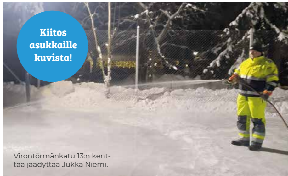
Virontörmänkatu 13:n kenttää jäädyttää Jukka Niemi.

Eikä sitä koskaan tiedä kuinka isoille jälle tie kotipihasta lopulta johtaa.