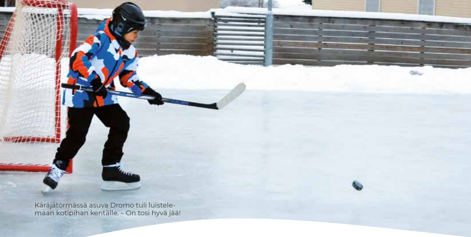
Käräjätörmässä asuva Dromo tuli luistelemaan kotipihaan kentälle. – On tosi hyvä jää!