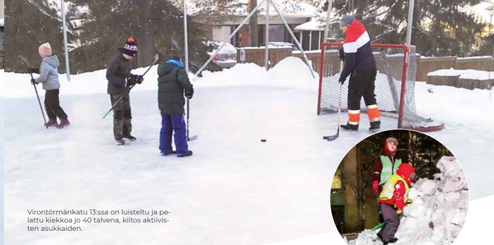
Virontörmänkatu 13:ssa on luisteltu ja pelattu kiekkoa jo 40 talvena, kiitos aktiivisten asukkaiden.