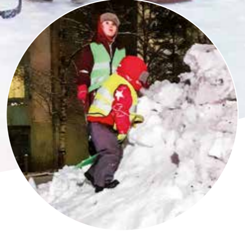
Lumitalvi on tuonut paljon iloa. Ylioppilaankadulla asuvat tytöt kiipeilevät ja laskevat kotipihaan lumikasassa.