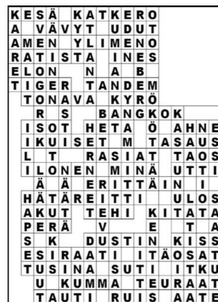
Ristikon vastaus sivulta 17

Read more www.titry.com/vts and don't hesitate to contact us!