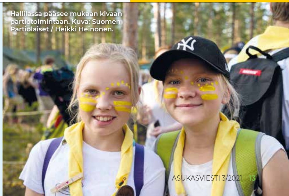
Hallilassa pääsee mukaan kivaan partiotoimintaan.

Sudenpentuja vähän vanhemmat Seikkailijat eli 10–12 vuotiaat tytöt ja pojat kokoontuvat torstaisin kello 18–19. Seikkailijoiden partiolippukunta on Hervannan Hukat.