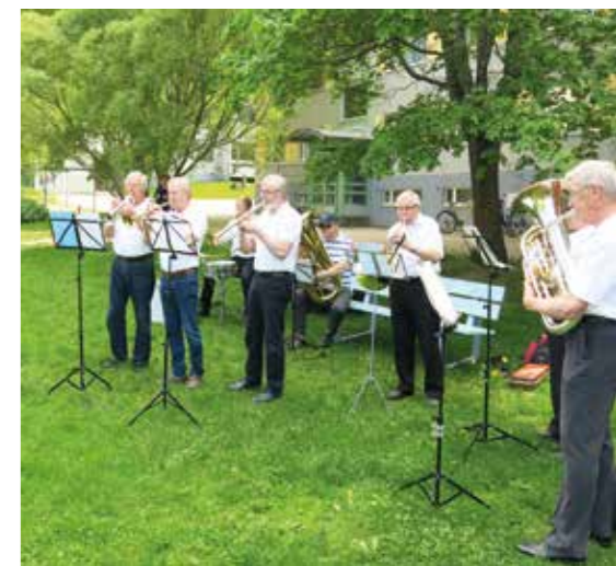
Rautatieläisten soittokunta toi avajaisiin komean musiikkitervehdyksen.