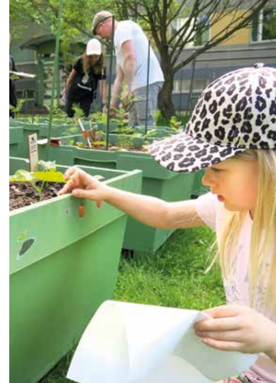
Istutuslaatikoita koristeltiin tarroilla.