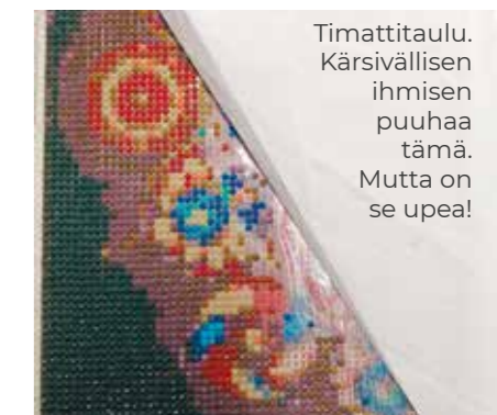
Timattitaulu. Kärsivällisen ihmisen puuhaa tämä. Mutta on se upea!