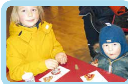
Haapalinnan Noomi ja Lenni Koiramäen piparipajassa.

Kiitos kaikille mukana olleille kivasta seurasta!