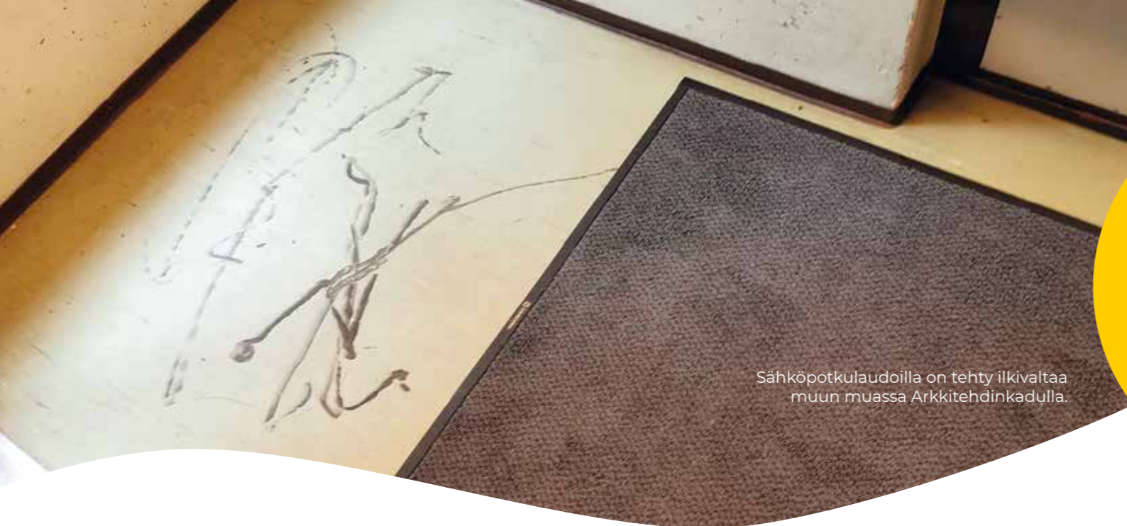
Sähköpotkulaudoilla on tehty ilkivaltaa muun muassa Arkkitehdinkadulla.