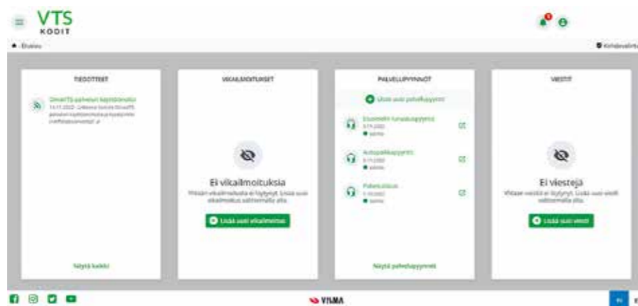
OmaVTS:ssä kaikki tarvittava löytyy kätevästi samalta sivulta.

VTS-kodit on tarjonnut jo pitkään asukkaalle monipuolisia sähköisiä palveluita. Uuden OmaVTS-porta-