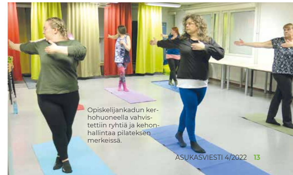
Opiskelijankadun kerhohuoneella vahvistettiin ryhtiä ja kehohallintaa pilateksen merkeissä.

Pilates on hieman joogaa muistuttava liikuntamuoto, joka vahvistaa kehon syviä lihaksia ja venyttää kireitä lihasryhmiä. Pilateksen avulla voi vahvistaa tehokkaasti ryhtiä ja lihaskuntoa, ja tärkeässä roolissa ovat kontrolli ja hengitys. Opiskelijankadun kerhohuoneessa vallitsikin keskittynyt hiljaisuus, kun osallistujat keskittyivät hengittämään sisään ja ulos taivutusten ja venytysten tahdissa.