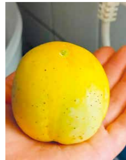
Sitruunakurkku on keltainen ja pyöreä, mutta se maistuu tavalliselta kurkulta.