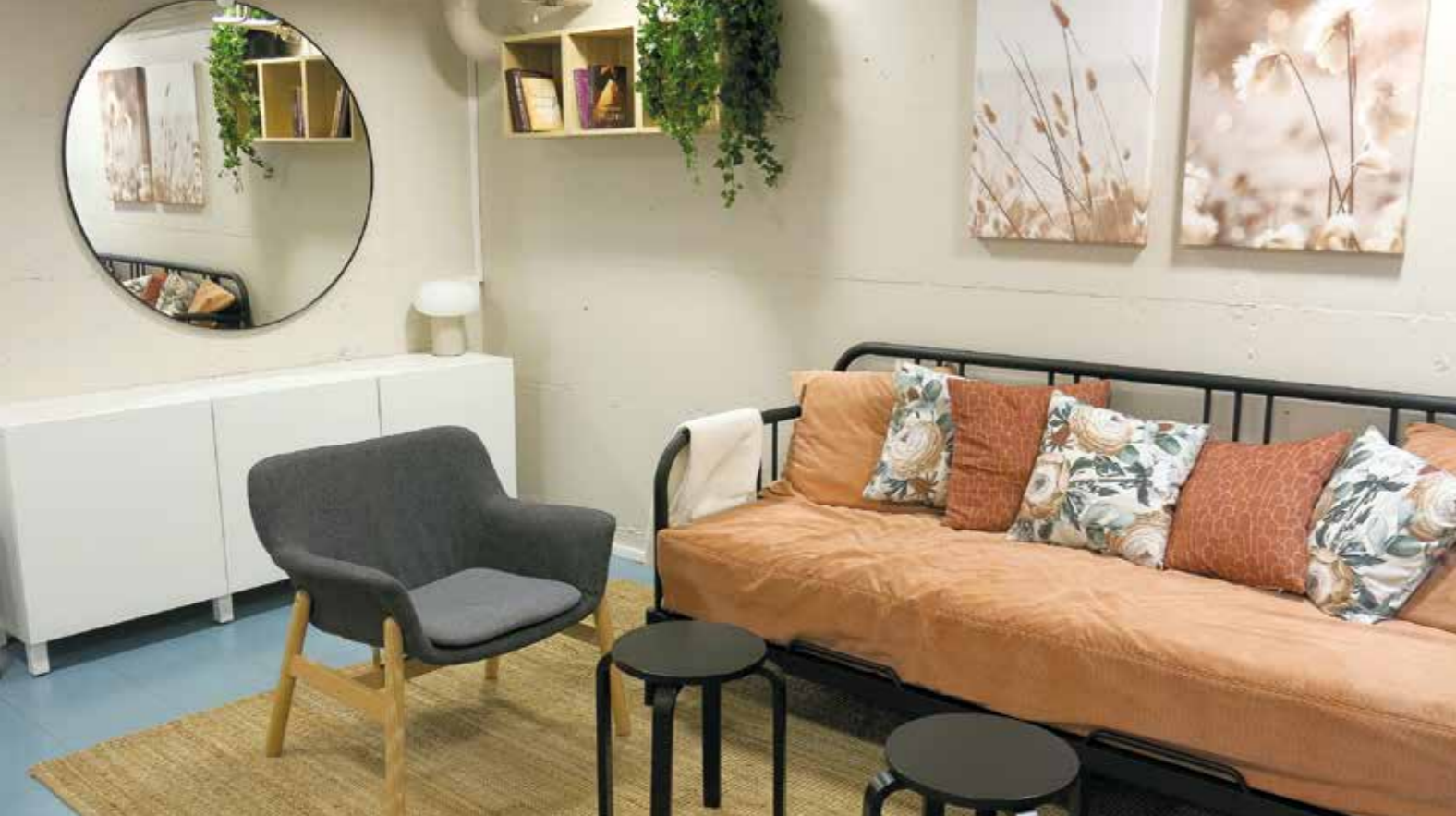
Possilankadun uudistettu kerho huone on viihtyisä ja sopii monenlaiseen käyttöön.