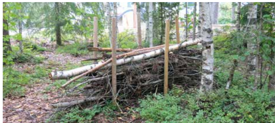
Männikönkatu 7:n pihassa sijaitseva risuaita sulautuu hyvin puiden lomaan.