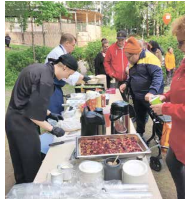
Opiskelijankatu 21–23:n korttelitapahtumassa oli tarjolla marjapiirakkaa ja kahvia.

kitapahtuma”. Ensimmäinen koikeilu järjestettiin Tohlopinkadulla maaliskuussa 2015. Tapahtumassa oli tarjolla hernekeittoa ja kahvia sekä viihdykkeenä musiikkiesitys. – Tästä pilotista toimineesta tapahtumasta saatiin hyvää palautetta ja tuli vahvistusta siihen, että tällaiselle kohtaamiselle on olemassa tilausta.