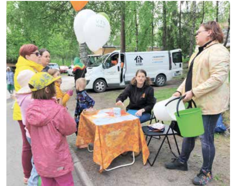
Titry ry ja Nextiili ry ottivat korttelitapahtumissa vastaan kierrätystekstiilejä, pieniä sähkölaitteita sekä kodin vaarallista jätettä.