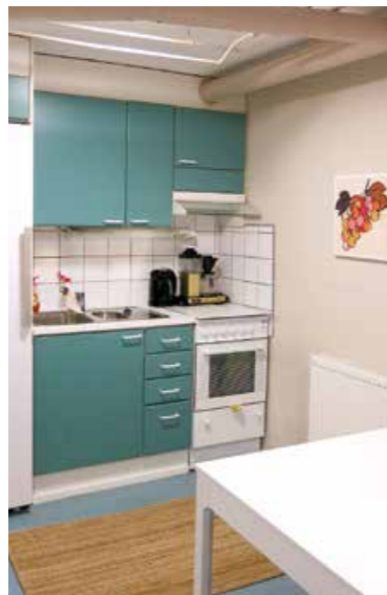
Kerho huoneen keittiön kaapit ovat alkuperäiset. Ovien pesun ja uusien vetimien myötä koko keittiönurkkauksen ilme piristyi.