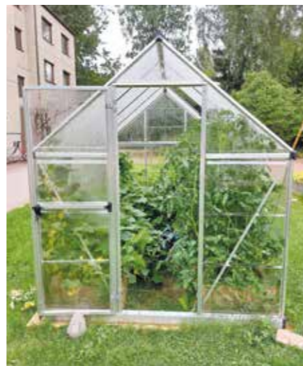
Palokallionkadun kasvihuoneessa kasvoi kesällä 2023 tomaatteja, kirsikkatomaatteja, avomaankurkkuja sekä sitruunakurkkuja.