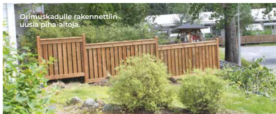
Orimuskadulle rakennettiin uusia piha-aitoja.

– Vaikka VTS-kotien kiinteistöt ovat yleisesti hyväkuntoisia, on kiinteistöjen välillä jo niiden iästäänkin johtuen tosi isoja teknisiä eroja.