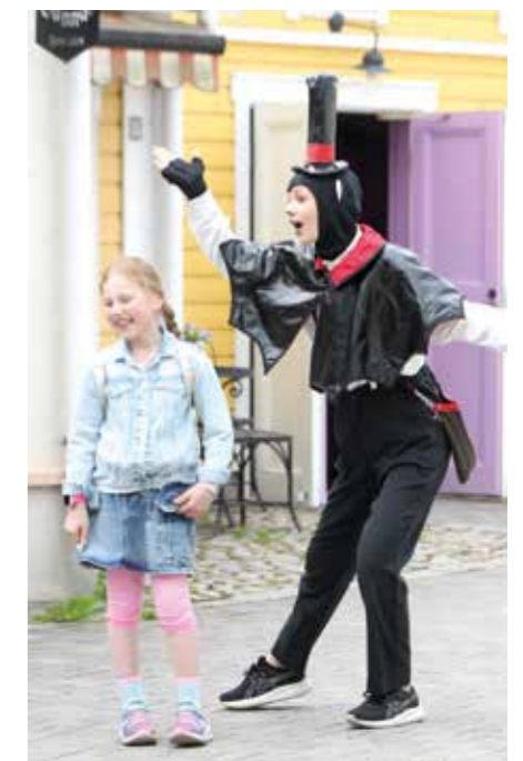
Koiramäessä VTS-kotien vieraat otettiin lämmöllä vastaan.

– Vuokralla asumme nykyin. Halusimme pois kaupungista, että lapsilla on kasvaessaan enemmän tilaa leikkiä ja touhuta. Ruutanasta löytyi meille sopiva koti.