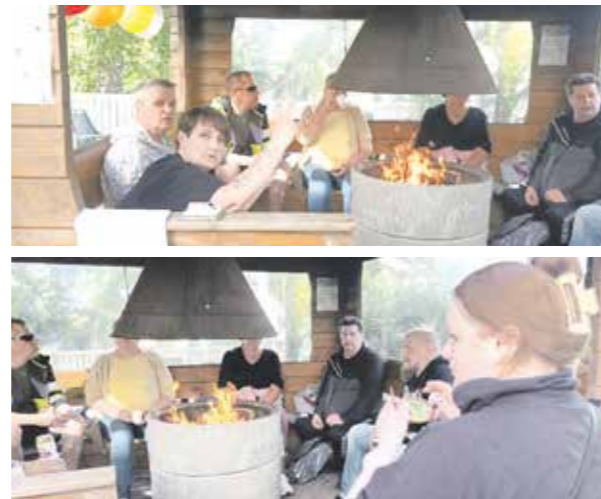
▲ Grillikatot oli synttären keskipiste, jonne kokoontuttiin syömään ja juttelemaan.